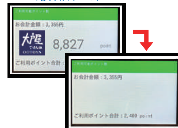
(端末画面イメージ)

残高ポイントを確認されましたら、 使用されるポイント数を従業員にお伝えください (1ポイント単位でのご利用が可能です)