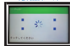
(端末画面イメージ)